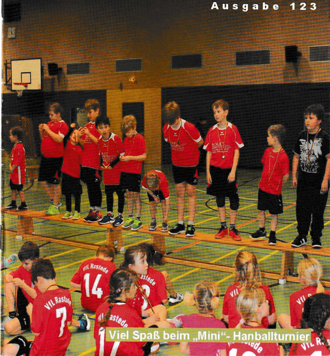
Viel Spaß beim „Mini“- Handballturnier