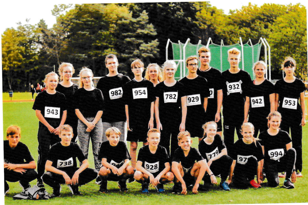
Athleten des Kreises Nordwest beim Kreisvergleichswettkampf

Für uns steht im nächsten Jahr auch wieder eine neue Herausforderung an, auf die wir uns freuen. Der Rhodolauf, der zuvor durch die Sportfreunde Westerstede ausgerichtet wurde, wird nun in Zusammenarbeit mit den ehemaligen Organisatoren unter Federführung der TSG Westerstede ausgerichtet. Am 14. Juni wird im Rhodopark die 4. Auflage des beliebten Laufes starten.